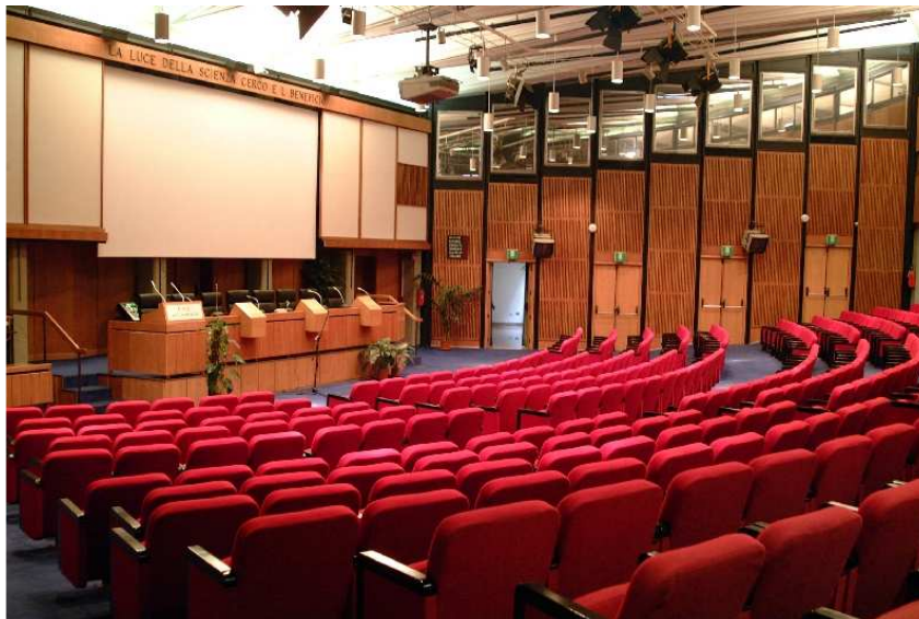
Sala Convegni del CNR

Le sessioni di Nanotec2009.it si tengono nella Sala Convegni del CNR capace di ospitare fino a 350 delegati. La sede CNR è coperta da rete wireless.