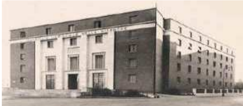
Inaugurazione della Sede Centrale CNR - (21/11/1937)

Nanotec2009.it si tiene a Roma nella sede Centrale del CNR sita in Piazzale Aldo Moro, 7 .